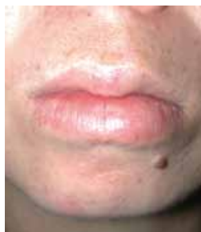
図1 口腔アレルギー症候群(膨れた唇)

食物アレルギーについては拙著『診療所で診る子どもの皮膚疾患』(日本医事新報社刊) p170を参照して下さい。