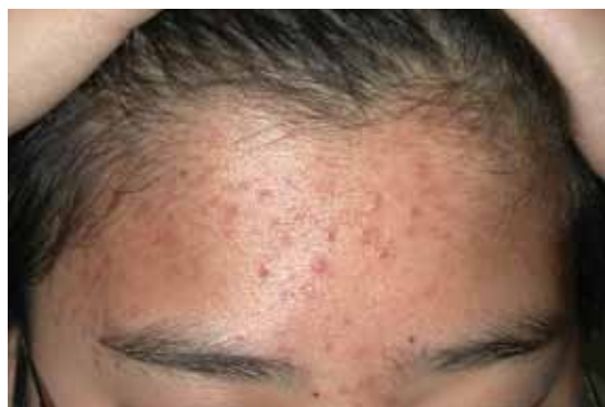
図2 図1に紅色丘疹が出現