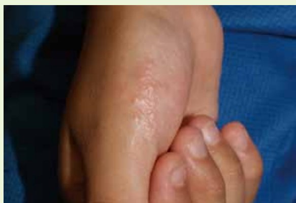
⑥ 手に水疱のようなものができた？