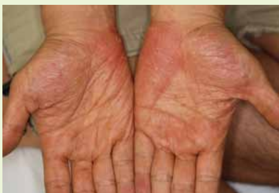
⑤ 「なかなか治りません」と医院を転々とした患者