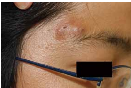
図3 膿疱、結節が出現