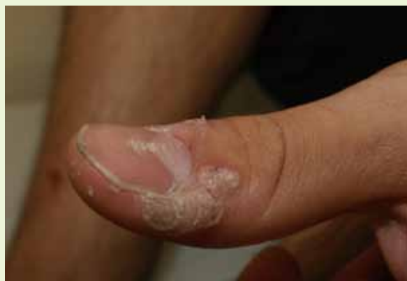
② 成人の手の指に何かできた？