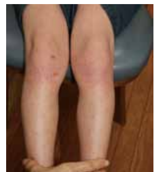
図3 アトピー性皮膚炎