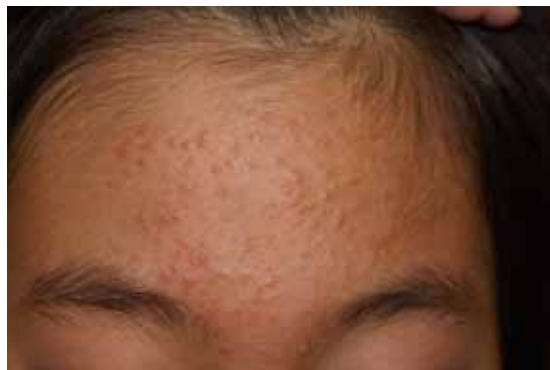
図1 面皰主体のざ瘡