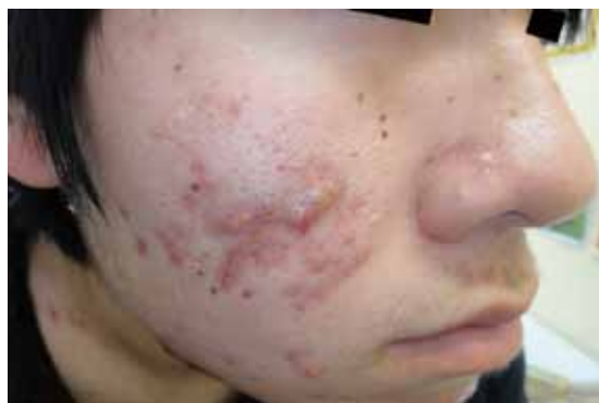
図4 ざ瘡による癬痕