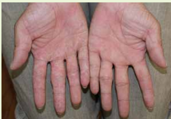
③ 成人の手の片側に何かできた？