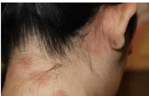
頭皮のこすり過ぎ