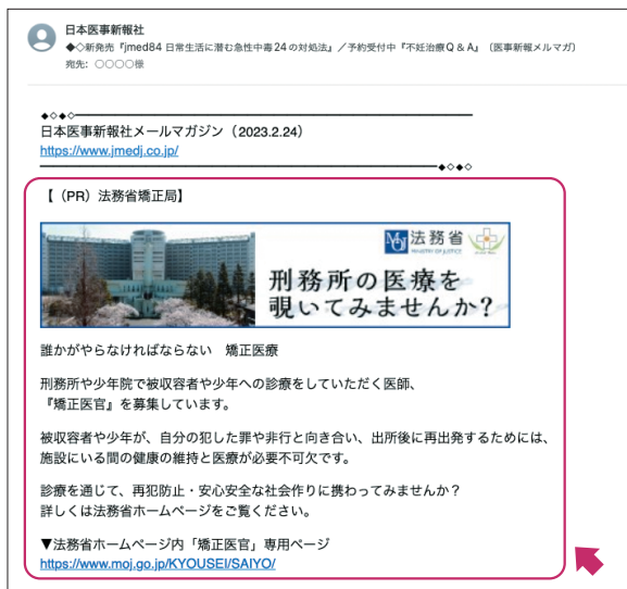
テキスト+バナーのイメージ